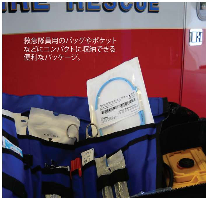
救急隊員用のバッグやポケットなどにコンパクトに収納できる便利なパッケージ。