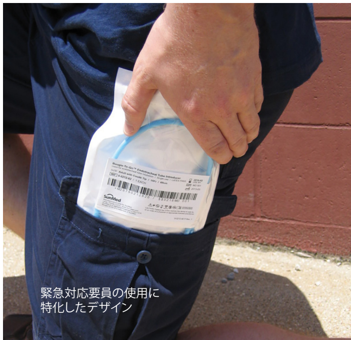
緊急対応要員の使用に特化したデザイン

SunMed®のBougie-To-Go™ラテックスフリーイントロデューサは、緊急対応要員（ファーストレスポnder）による使用を想定して開発されました。従来のイントロデューサと同様の適度な硬さと柔軟性がありますが、コンパクトなパッケージがBougie-To-Goの特徴です。緊急対応要員の使用するバッグやポケットなどの小さな収納スペースにも収まります。