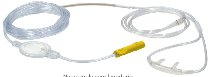
Neuscanule voor langdurig gebruik