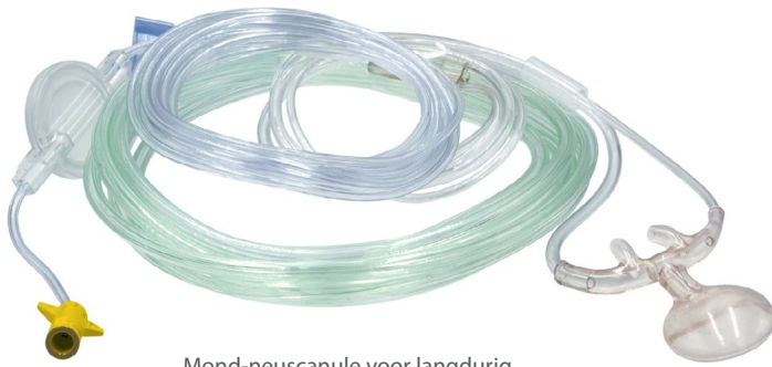
Mond-neuscanule voor langdurig gebruik

EtCO 2 -canules voor langdurig gebruik omvatten Nafion-slangen voor vochtregulering.