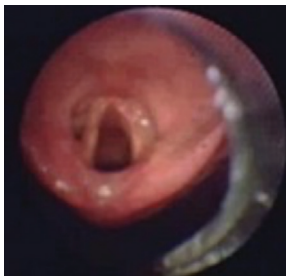
Air-Q®3-sarja kurkunkannen nostajalla